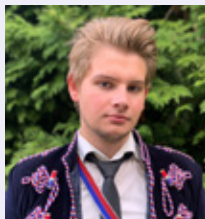
Scriptor: Hergen Stanislawski